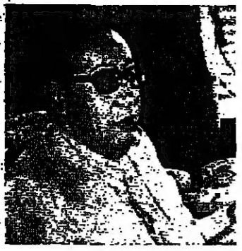
سفير الجزائر السيد محمد بنون